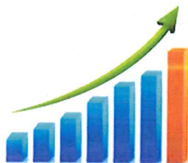
Rysunek 1. Przykład opisu wykresu

Elementy graficzne mogą być wykonane w wersji kolorowej lub czarno-białej. W przypadku zamieszczenia kolorowego rysunku, który będzie wydrukowany na czarnobiałej drukarce, należy sprawdzić jego czytelność. Poniżej zamieszczono przykładowy rysunek.